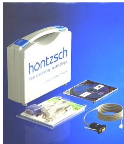
PC programovací kabel s CD-ROM UCOM

Höntzsch GmbH & Co. KG Gottlieb-Daimler-Straße 37 D-71334 Waiblingen Telefon +49 7151 / 17 16-0 E-Mail info@hoentzsch.com Internet www.hoentzsch.com