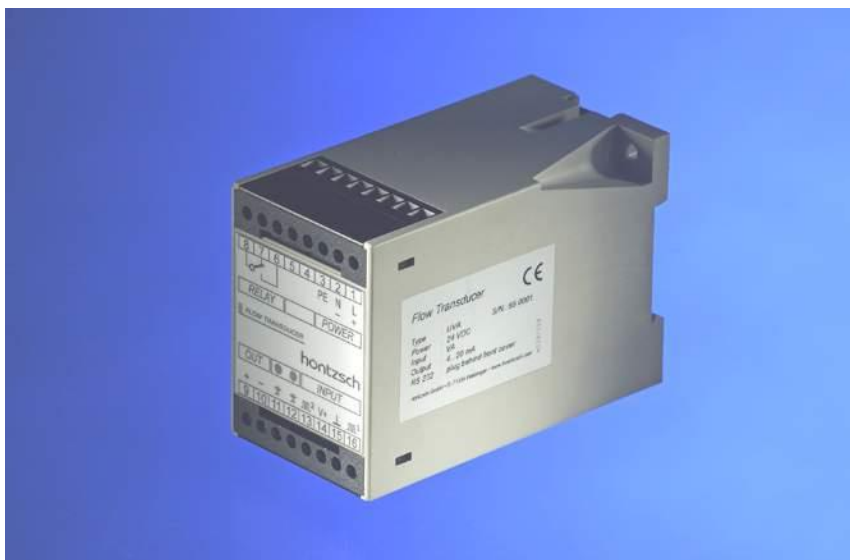
UVA v pouzdru LDG16