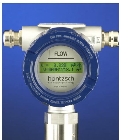
Ex-d pouzdro převodníku s volitelným LCD displejem