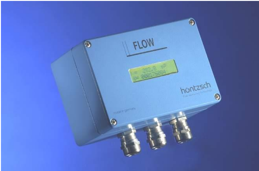
Umformer UFA im Gehäuse AS102