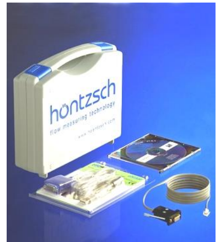
PC Anschlussleitung mit CD-ROM UCOM