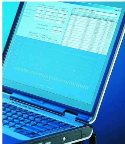
PC mit Konfigurierungs-Software UCOM