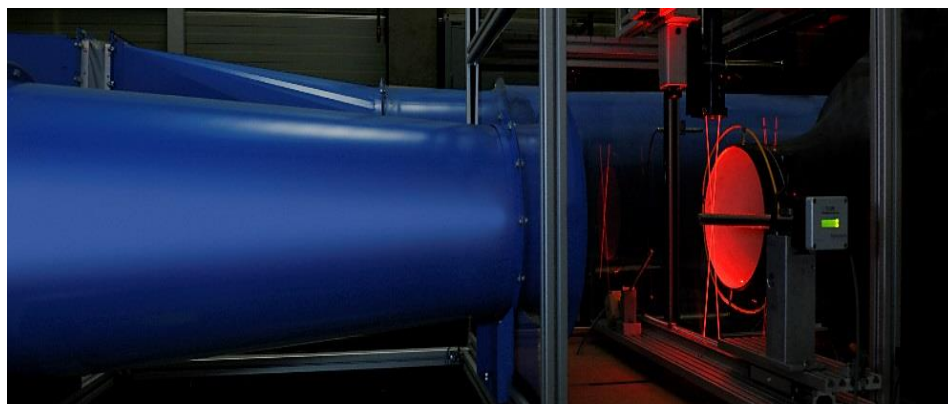
Freistrah-Windkanal WK320 mit Laser Doppler Anemometer (LDA)